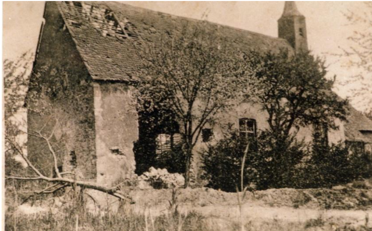
Chapelle Saint Wendelin partiellement détruite

Vous possédez des photos de Burnhaupt-le-Bas d'avant 1914, de la période de la guerre 14-18 et de l'après-guerre. Merci de contacter la mairie pour nous aider à préparer une importante exposition en septembre.